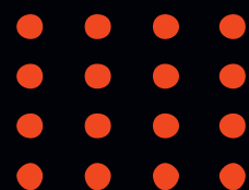
IMAGEN DE REFERENCIA TÉCNICA

E - Rosca. diámetro exterior y el número de hilos por pulgada. A - Longitud total desde el centro de la tuerca hasta el final de la espiga C - Longitud de la rosca, la parte que se atornilla. S1 - El tamaño de la llave (en mm) que necesitas para apretar la tuerca